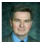
Vincent Rigby Sous-ministre adjoint (POL) Quartier général de la Défense nationale